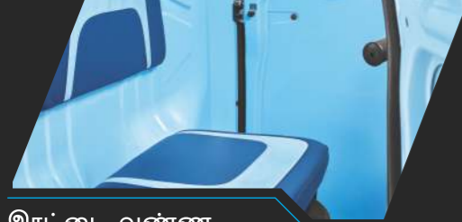
இரட்டை வண்ண இருக்கைகள்