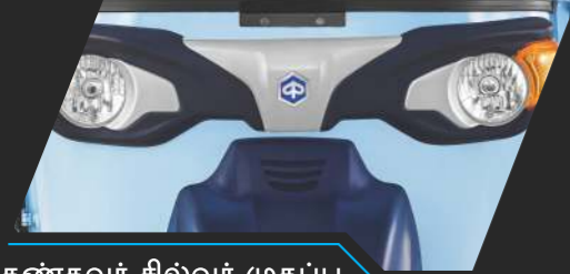
கண்கவர் சில்வர் முகப்பு பேனல்